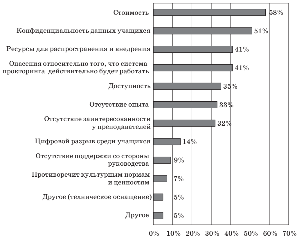
Рис. Проблемы, связанные с онлайн-прокторингом Fig. Online Proctoring Issues

За рубежом стоимость онлайн-экзамена колеблется от 7 до 15 долл. за автоматическую аутентификацию и от 10 до 25 долл. за экзамен, проводимый человеком в режиме реального времени (на момент 2017 г.). Колледжи и университеты, которые ежегодно проводят десятки тысяч экзаменов, и, как сообщается, учебные заведения либо взимают со студентов плату за каждый онлайн-тест, который они проходят, либо повышают общие сборы, чтобы покрыть общую стоимость онлайн-экзамена. Но будем учитывать ситуацию, что за рубежом в большинстве западных стран превалирует идея платного образования и вопрос распределения бюджета образовательной организацией иной 1 .