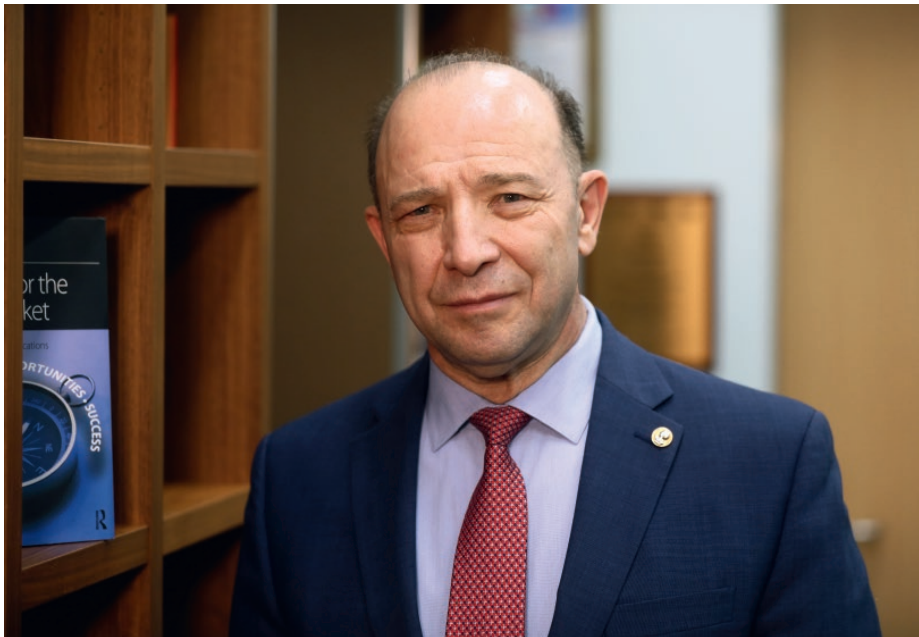
Иностраный член РАН, профессор В.Л. Квинт

приоритетов, взаимозаменяемых в зависимости от заранее предусмотренного широкого спектра вероятных стратегических опасностей и перспектив возникновения новых возможностей.